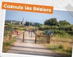
Cazouls les Béziers